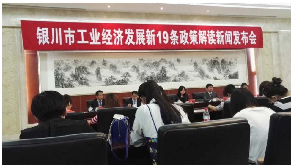
银川市工业经济发展新 19 条政策解读新闻发布会现场

读；8月初通过，对银川市目前执行的科技创新政策进行全面解读。这两次发布会既有宁夏电视台、银川电视台、宁夏日报、银川晚报等传统媒体参与报道，同时又通过新华网、微博等新媒体进行宣传，政策解读宣传力度大、受众面广，达到预期效果。