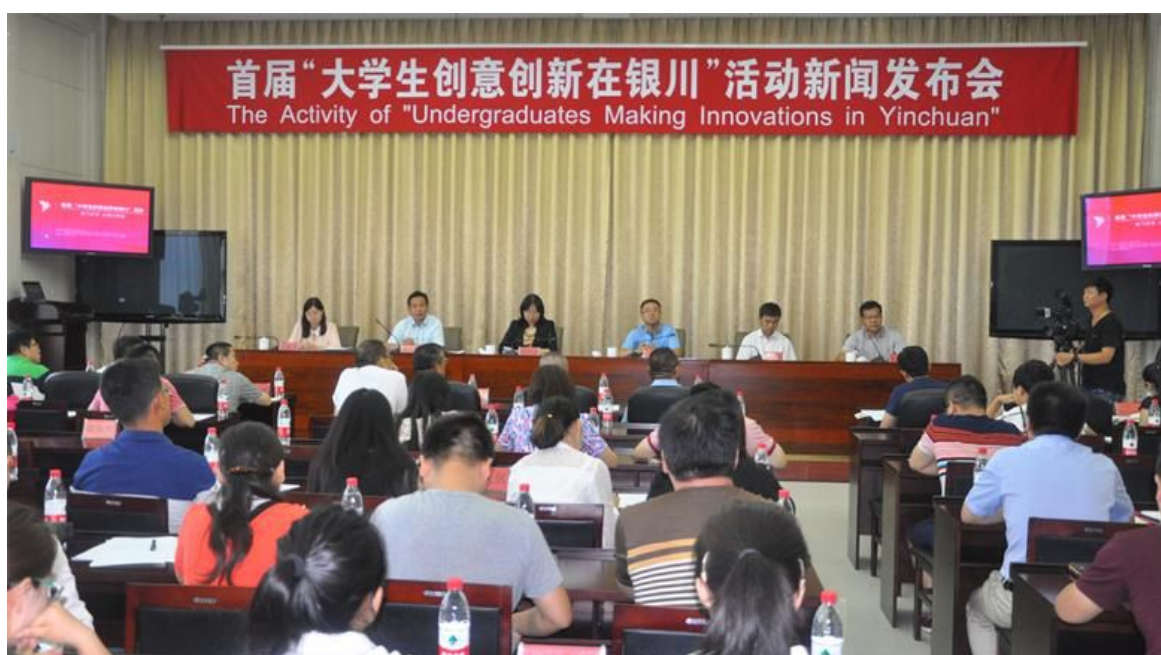
首届“大学生创意创新在银川”活动新闻发布会现场